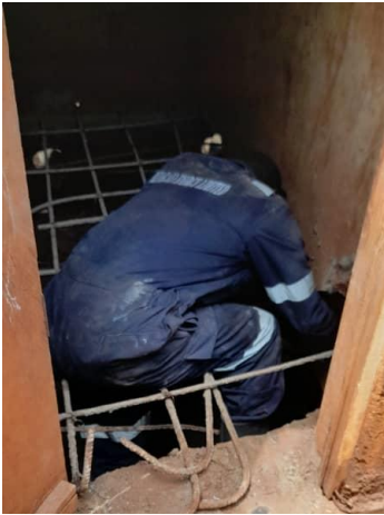
Vervangen van de toiletvloer

Samen met de directeur besloten we in 2022 vooral onderhoud werkzaamheden uit te voeren. Zo werden vloeren van enkele klaslokalen vervangen. Ook de vloeren van de eerste toiletgebouwen waren beschadigd door het legen van de put. Deze vloeren werden ook vervangen. De buitenkant van enkele klaslokalen werd geschilderd. Een lokale kunstschilder kwam een mooie muurtekening maken op een van de gebouwen. Alle bouwactiviteiten werden door lokale bouwlieden gedaan. Op die wijze steunen we de gehele gemeenschap.