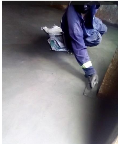
Vervangen vloer klaslokaal