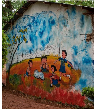
Muurschildering van lokale artiest